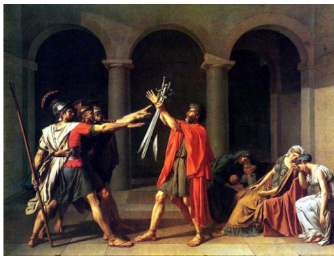
Jacques-Louis David, Le serment des Horaces , 1784 (musée du Louvre)

Les questions faciles, de simple logique et de lecture, alternent avec des questions nécessitant une connaissance générale de l'histoire des arts et de l'analyse iconographique. Exemple de l'analyse de document visuel :